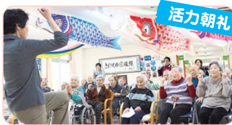
活力朝礼 朝から大きな声をだして、その日を元気に過ごします。