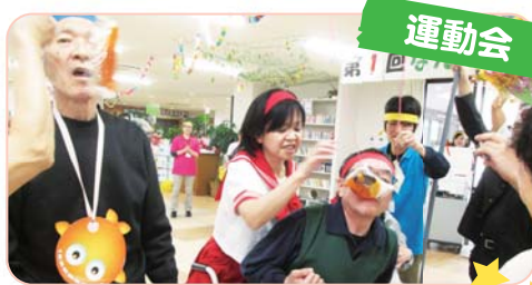
運動会 年に一度の運動会!色んな種目で優勝を目指しましょう!

「 幼・青・老 」の共生 幼年～青年～老年、共に楽しく過ごせるような社会作りを目指します。