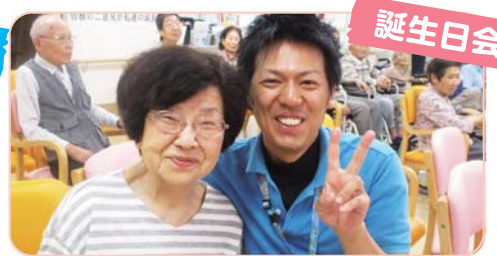
誕生日会 毎月、誕生日会を盛大に行っています。