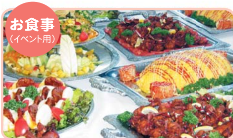
お食事 (イベント用)