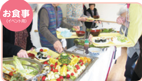
お食事 (イベント用)